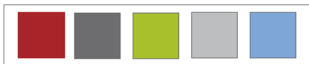
Bordeaux Graphite Lime Light gray Light blue